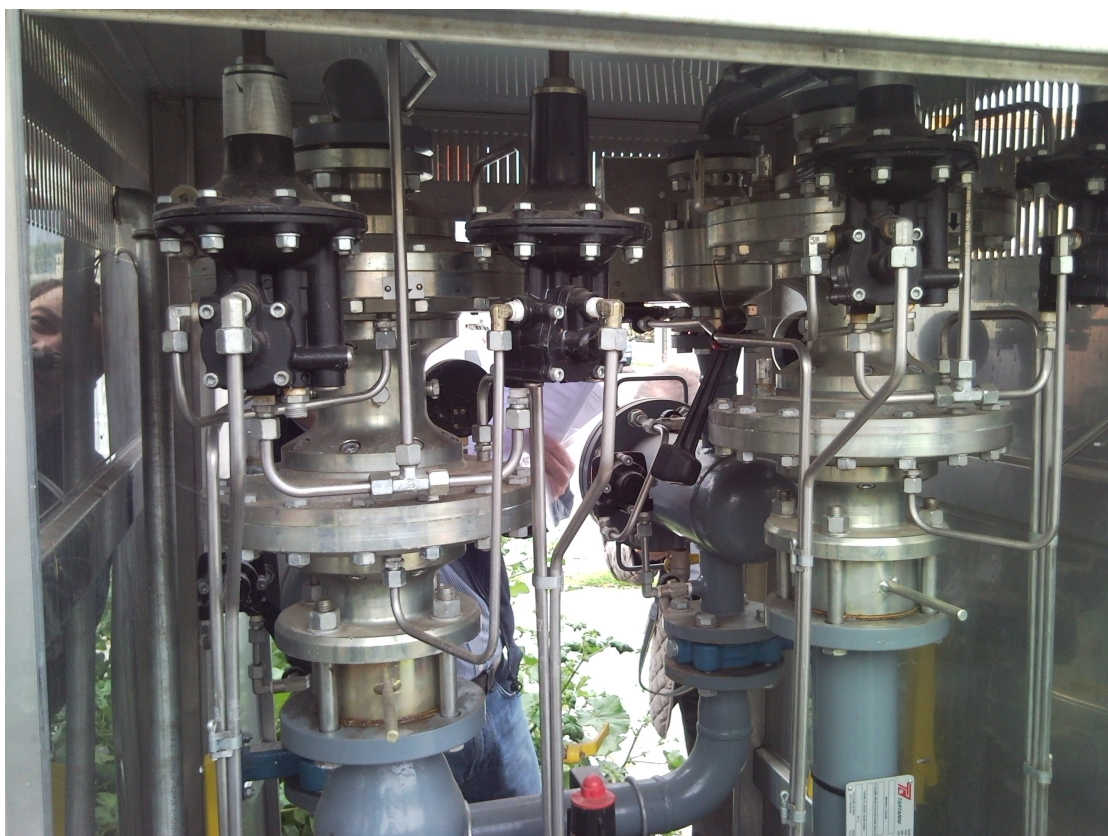
GRF N° 3 Via Dante Alighieri - Lanzara FOTO N° 1