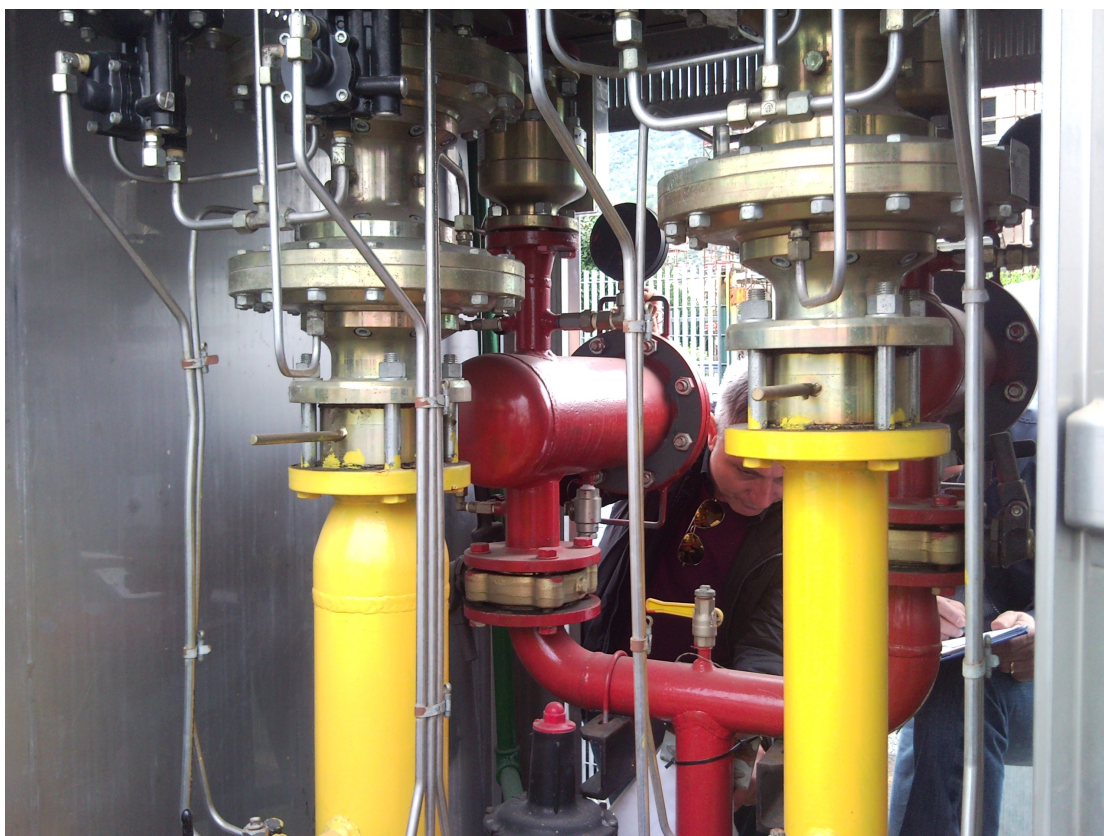
GRF N° 2 Via Togliatti -Trivio FOTO N° 1