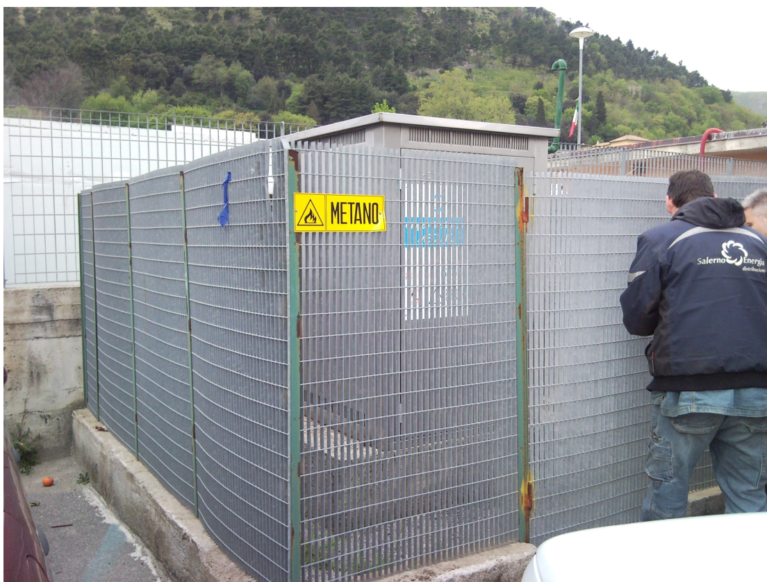
GRF N° 1 Via A. Capuano – Nuovo Mercato FOTO N° 1